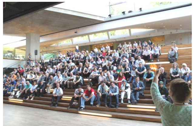
در سالن موزه. هنوز همه از راه نرسیده‌اند

نام‌نویسی و اعلام حضور در گردهمایی از ساعت ۱۳ روز جمعه ۲۳ ژوئیه در محوطه بیرون تالارهای هتل محل برگزاری گردهمایی آغاز شد. در همان محل و به موازات نام‌نویسی، نمایشگاه جانبی گردهمایی با شرکت صاحبان صنایع و شرکت‌ها یا نمایندگانشان، و نیز یک نمایشگاه نقاشی و یک نمایشگاه عکس جریان داشت. گزارش نمایشگاه نیز جداگانه در همین شماره آمده است.