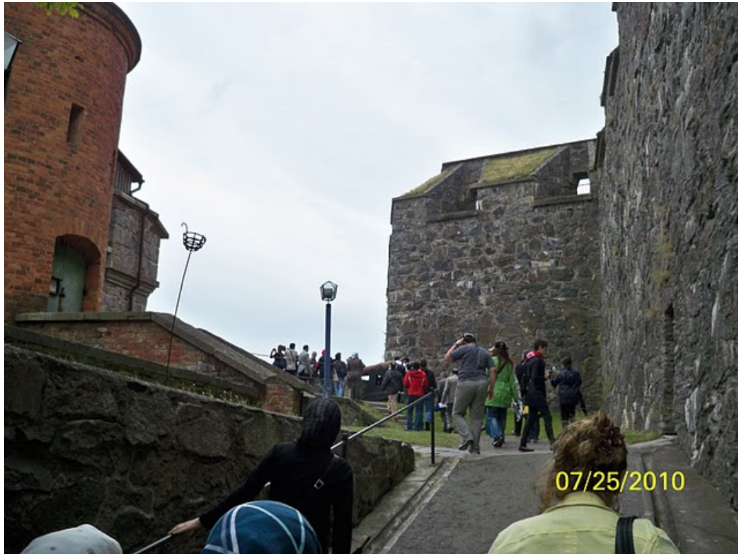
قلعه - زندان کارلستن