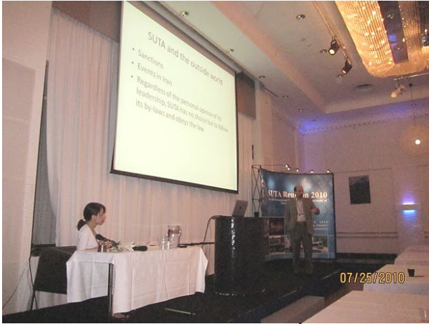
رئیس هیأت مدیره انجمن گزارش می‌دهد