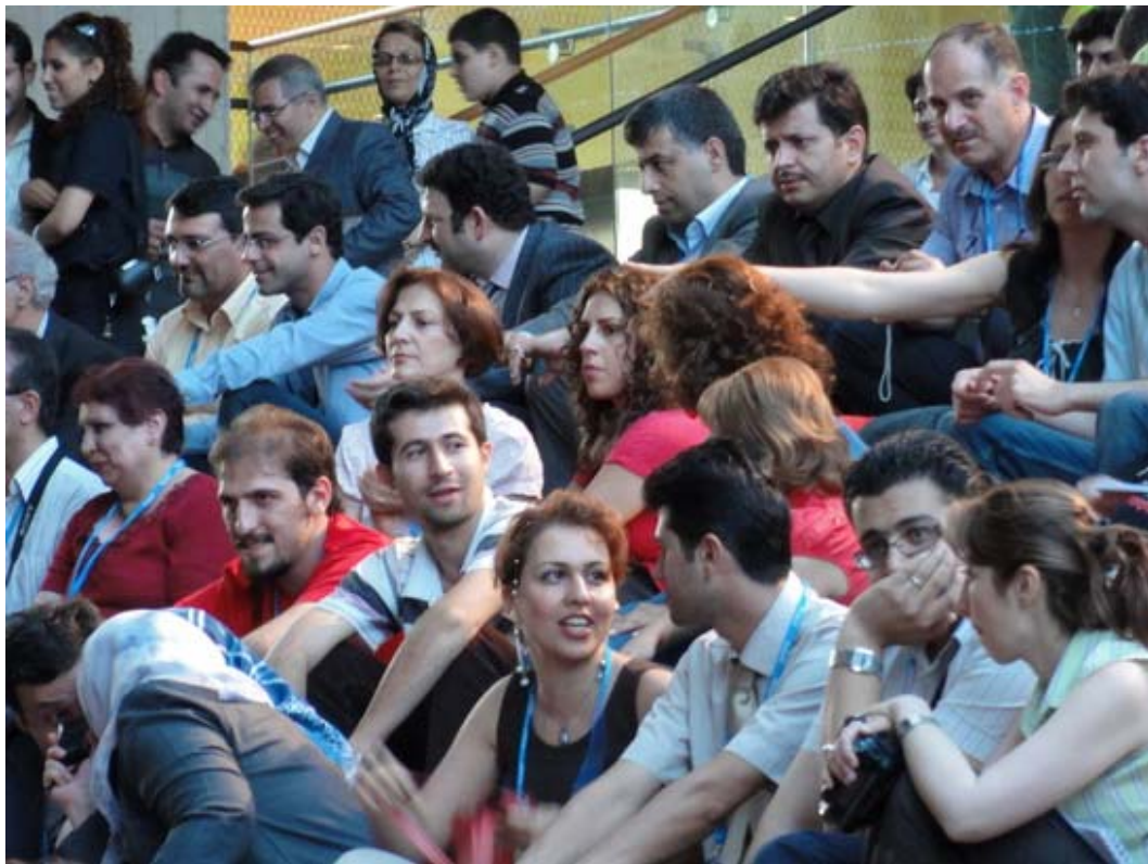
"جوان ترها" اکثریت را در میان شرکت کنندگان گردهمایی امسال داشتند