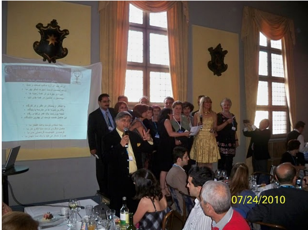
گروه همسرایان سرود سوتا را می‌خواند