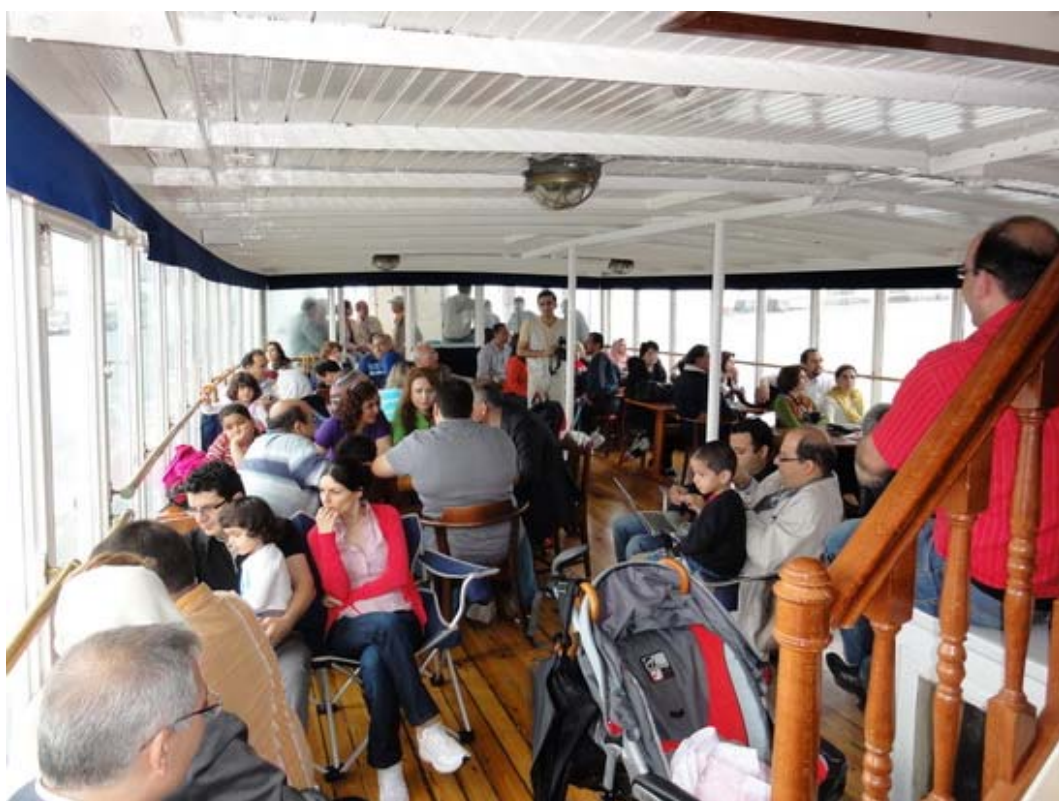
سوار کشتی، به سوی جزیره و قلعه‌ی مارشتراند