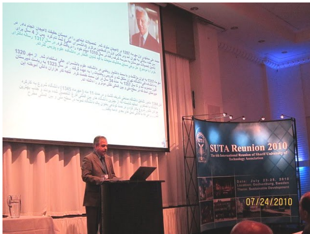
گزارش جایزه نوآوری دکتر مجتهدی