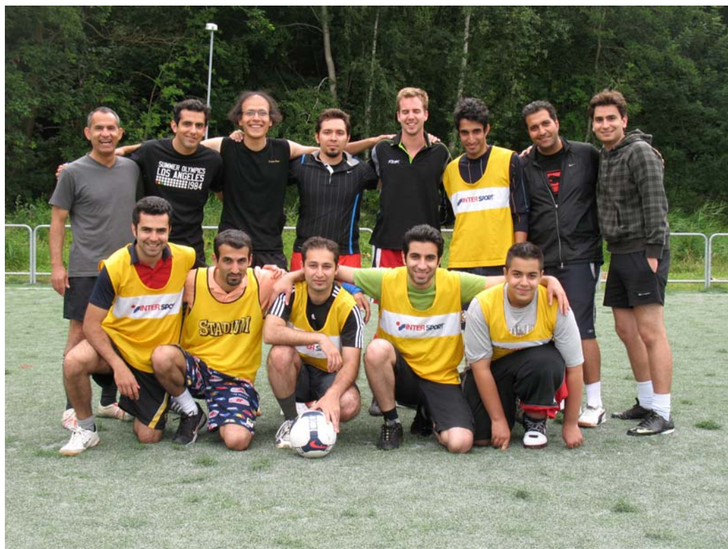
لباس تیره: تیم ووزلا، لباس زرد: تیم پرشین گلف