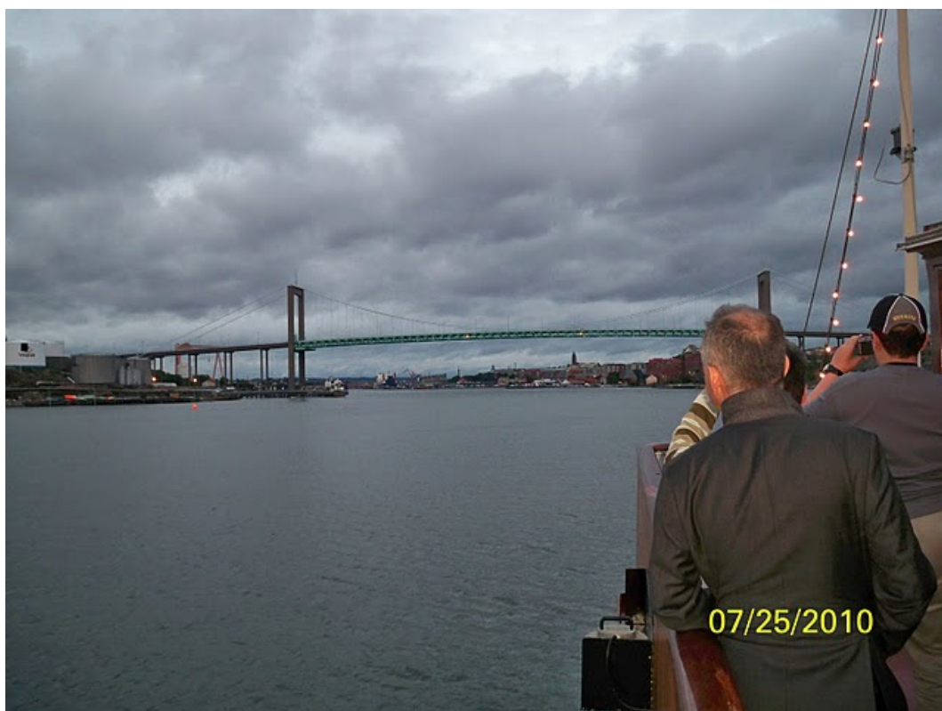
بازگشت به سوی بندرگاه گوتنبورگ