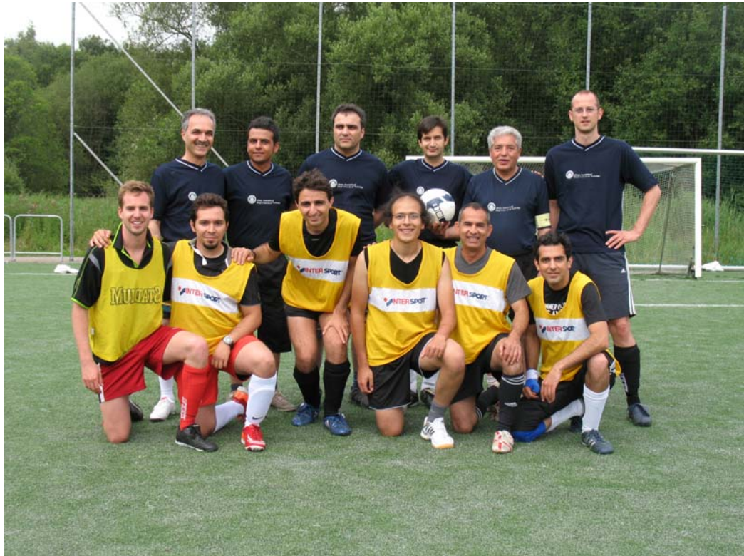
ایستاده: تیم کمیته ورزش، نشسته: تیم ووزلا