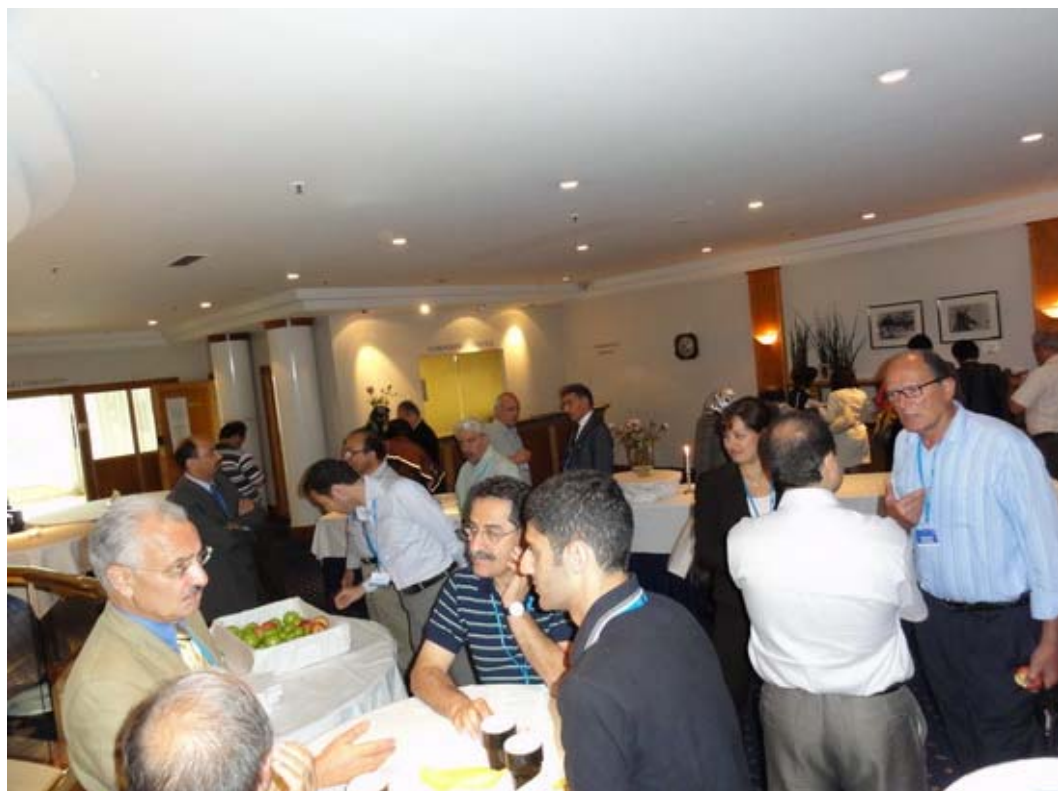
... و "جوان ترها" می خواستند از "جوانان" بیاموزند!