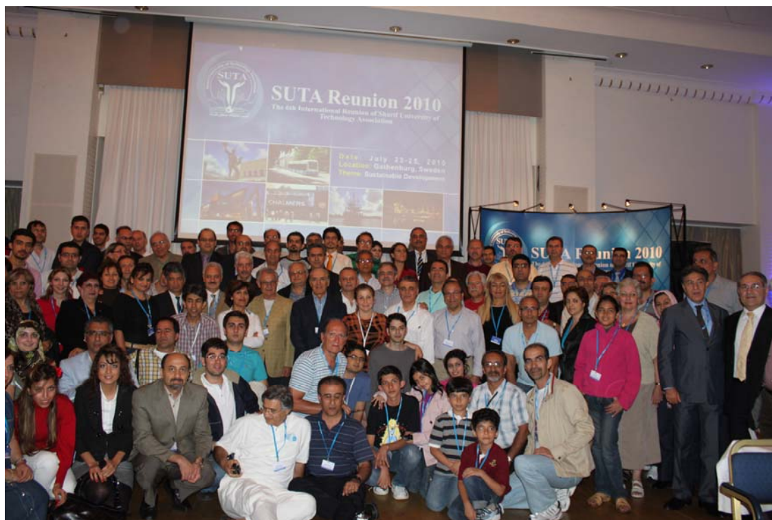
پایان اجلاس رسمی. افسوس که همه در عکس حضور ندارند!