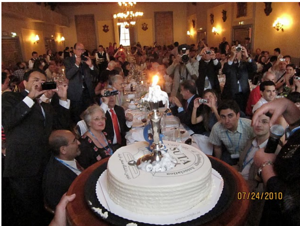
کیک ده‌سالگی سوتا