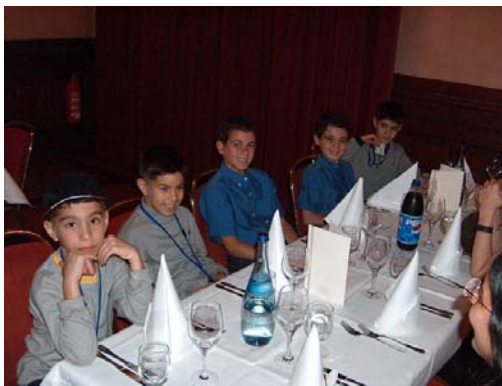
نسل جدید دوستداران انجمن