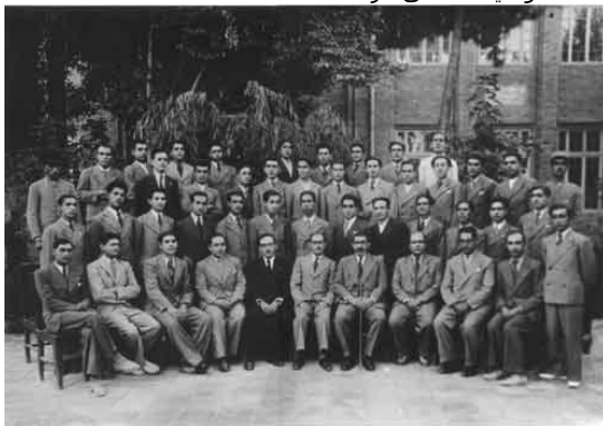
استاد و دانشجویان دوره اول دانشکده فنی در زمان استقرار موقت در دارالفنون - سال ۱۳۱۴