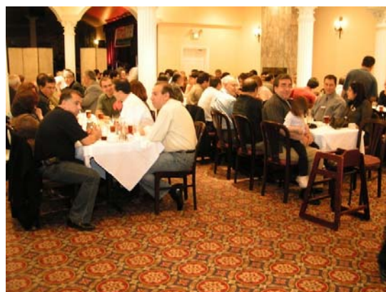
شام در ابرونگ