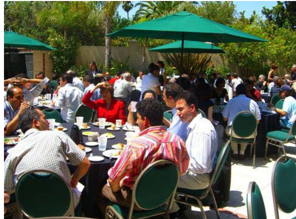
شرکت کنندگان در گردهمایی در حال صرف ناهار