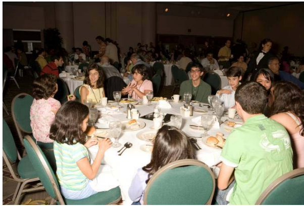
نسل آینده در حال تمرین