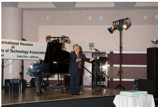
هنرمند مشهور انوشیروان روحانی