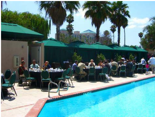
صرف نهار در کنار استخر هتل هاییت