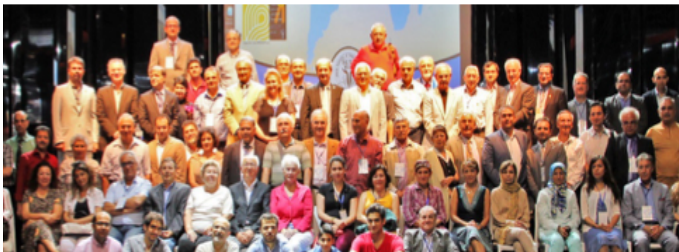
گردهمایی سال ۲۰۱۴ میلان - ایتالیا

Board was also challenging. (I belong to a generation that was mid-level and I had to keep people who were 20+ years older than me, and 20+ years younger than me happy at the same time, and sometimes that was not that easy)