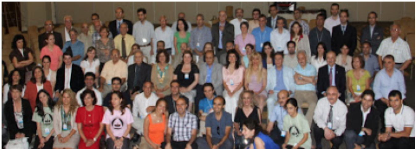
گردهمایی سال ۲۰۱۲ در اتاوا- کانادا

ج: برگزاری جلسات متعدد در شاخه های مختلف محلی انجمن سوتا