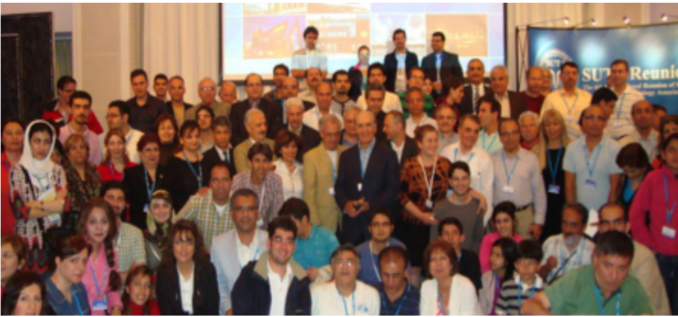
گردهمایی سال ۲۰۱۰ در گوتنبرگ - سوئد

مهمترین چالشها در دوران ریاست شما چه بود؟ انجمن سوتا چه کارهای مهمی در آینده باید انجام دهد تا بعنوان یک سازمان غیر انتفاعی مستقل بتواند خدمت موثری به جامعه فارغ التحصیلان دانشگاه صنعتی شریف بنماید؟